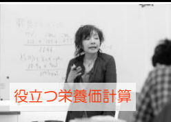
役立つ栄養価計算