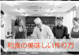
和食の美味しい作り方