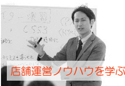
店舗運営ノウハウを学ぶ