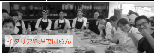
イタリア料理で団らん