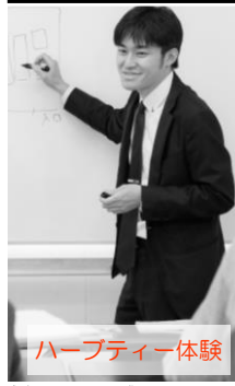
ハーブティー体験

授業の開始前に朝礼、終了後に終礼を行います。 訓練の一環として、日直および掃除当番等があります。 訓練中に実施するキャリアコンサルティングは放課後30分程度行います。(訓練期間中1人3回) 修了後に取得できる資格(任意受験)については、各自が受験した試験に合格することにより取得できます。 新型コロナウイルス感染症の感染状況によっては、一部内容が変更になることがあります。