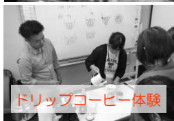
ドリップコーヒー体験