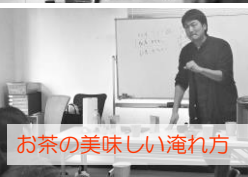
お茶の美味しい淹れ方