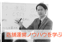
店舗運営ノウハウを学ぶ