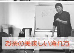
お茶の美味しい淹れ方