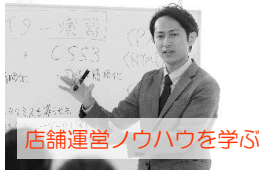
店舗運営ノウハウを学ぶ