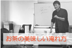
お茶の美味しい淹れ方