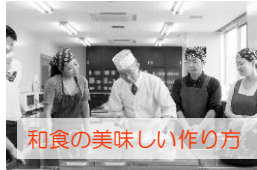
和食の美味しい作り方