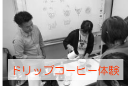
ドリップコーヒー体験