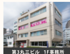
第3丸三ビル 1F事務所

参加される方は事前の申込が必要です。申込は左の2次元コードまたは電話にてお申し込みください。◎施設見学会への参加は、求職活動としてハローワークに認定されます。